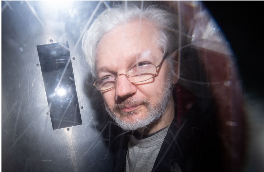
50 Wochen Haft wegen Verstosses gegen Kautionsauflagen: Julian Assange im Januar 2020 in einem Polizeiwagen auf dem Weg ins Londoner Hochsicherheitsgefängnis Belmarsh.